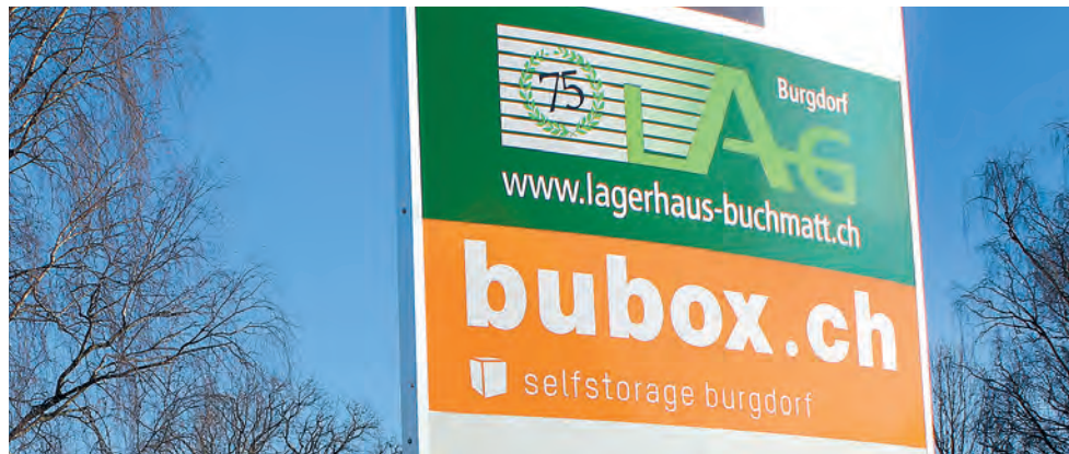
bubox befindet sich in einer Halle der Lagerhaus AG Buchmatt

bubox.ch bietet Privatpersonen und Unternehmen die Möglichkeit, kurzfristig, schnell und unkompliziert Lagerboxen verschiedener Grössen zu mieten. Beispielsweise weil ein Umzug bevorsteht und einige Möbel zwischengelagert werden müssen, oder weil man ein Akten-Archiv auslagern oder ein Warenlager führen will. Oder ganz einfach weil es im eigenen Keller zu eng geworden ist. Bei bubox.ch findet man eine passende Lagerbox, zu der man jederzeit uneingeschränkten Zugang hat.