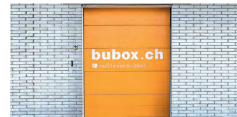
Eingangstor mit Rampe und Hebetisch

schlüssel auf das eigene Smartphone. Ermöglicht wird dies über eine Smartphone-App, die man als Benutzer kostenlos herunterladen kann. Wer's lieber ohne Handy und App will, kann stattdessen zu Bürozeiten eine Badge-Card abholen.